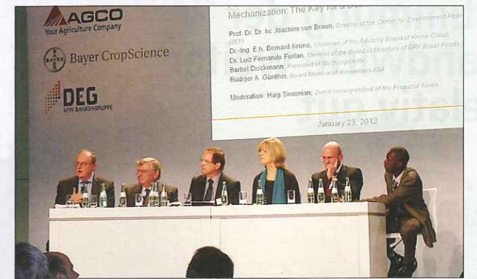
Podiumsdiskussionen vertieften die Diskussion über die Technisierung der afrikanischen Landwirtschaft.

Von Deutschland aus über die Verhältnisse in Afrika zu urteilen, ist zu einfach. Wer plant, muss sich vor Ort ein eigenes Urteil bilden. Teilweise dient Afrika als Halde für unseren Giftmüll und Elektronikschrott. Durch Auflagen und Verantwortungsbewusstsein können wir in der EU bereits dazu beitragen, die Verhältnisse in Afrika zu