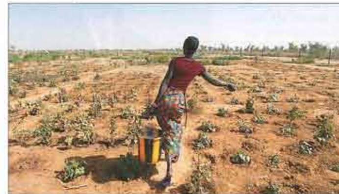
Die Frauen erledigen rund 70 Prozent der Feldarbeit in Afrika.

Nahezu die Hälfte der afrikanischen Ernte verdirbt, berichtete Ilse Aigner. Lagermöglichkeiten und rasche Transportwege bis zum Verbraucher fehlen häufig. Mangelnde Arbeits- und Verdienstmöglichkeiten auf dem Land lassen in Afrika viele Menschen in die großen Städte ziehen. In diesen Megacities können sich die Bewohner nicht mit selbst angebautem Obst und Gemüse versorgen.