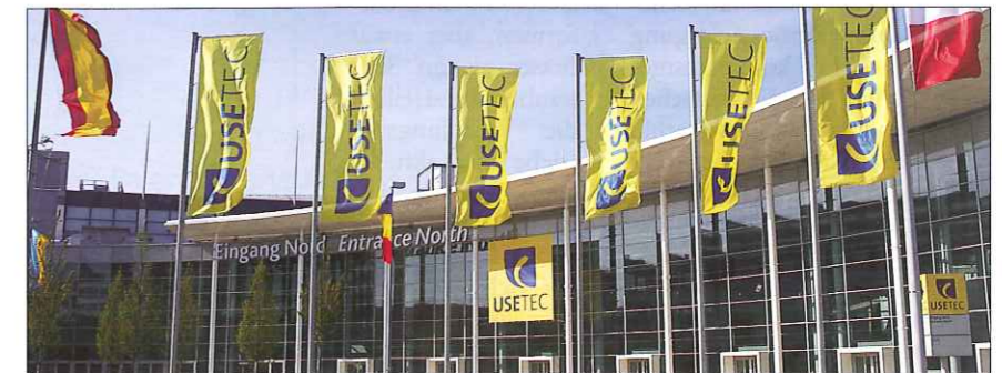
Das moderne Kölner Messegelände: USETEC und Internationale Eisenwarenmesse laufen parallel.

Und nicht nur deutsche Firmen bearbeiten die Märkte mit gebrauchten Produkten. Ein Drittel der USETEC-Aussteller stammt aus dem Ausland, aus nahezu 30 Ländern. Stärkste Ausstellernationen sind Italien, Niederlande, Schweiz, Großbritannien und Frankreich. Es wird Gruppenbeteiligungen der Verbände FDM, AIMUU (Italien), DUMA (Niederlande) und LandBauTechnik geben – ebenso der European Association of Machine Tools Merchants (EAMTM), die seit Dezember als weiterer Kooperationspartner der USETEC mit im Boot sitzt.