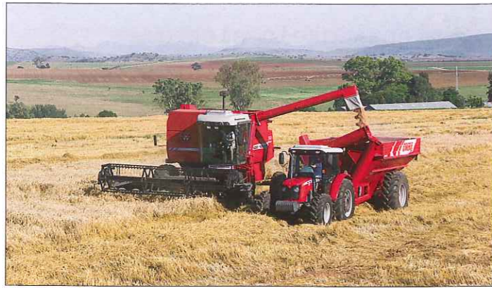
Je nach Klimaregion – Landwirte nutzen in Afrika auch moderne Landtechnik.